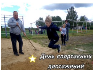
★ День спортивных достижений