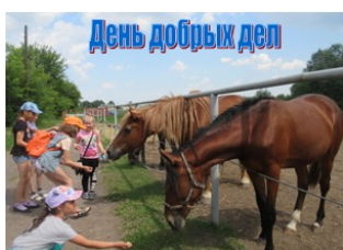
День добрых дел