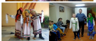
День истории России