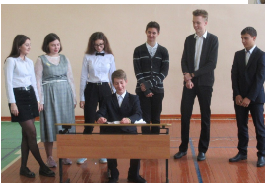
Поздравление учителям от учеников 11 класса «Письмо президенту»