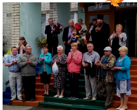
Чествование тех, кто строил школу и помогал готовить ее к открытию 30 лет назад