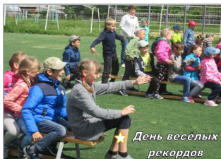
★ День веселых рекордов