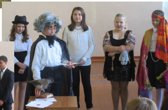
Поздравление учителям от учеников 4 класса «Битва Экстрасенсов»