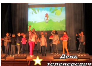
★ День телепередач