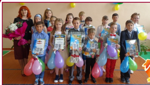
4 класс прощается с начальной школой