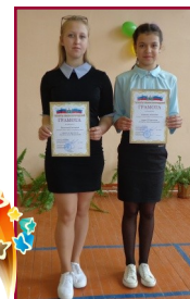
Лауреаты XIV фестиваля «Галанты земли Богородской»