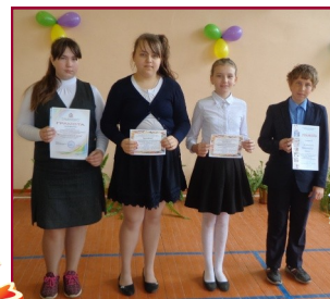
Участники районных конкурсов