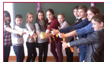
Название игры «КВЕСТ» образовано от английского слова «quest», которое переводится как «искать, разыскивать».