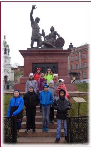
У памятника К. Минину и Д. Пожарскому в Н. Новгороде